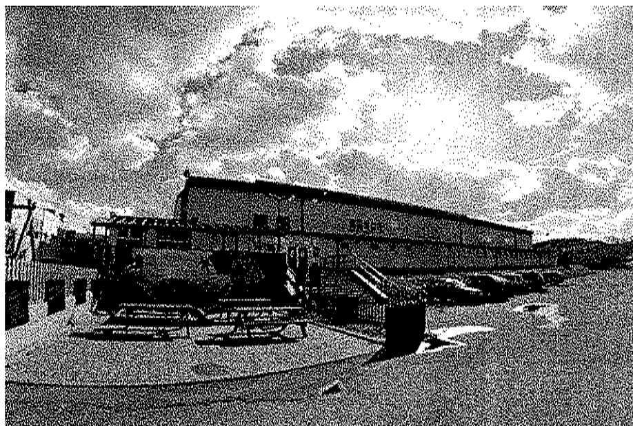
Foto: Zimní stadion Nový Jičín – pohled na hlavní vchod ze severní strany

Zimní stadion v Novém Jičíně je od roku 2011 provozován Hokejovým klubem Nový Jičín, z. s. Od té doby se někdejší zastaralá hala proměnila v multifunkční sportovní – společenský areál s celoročním provozem. Ledovou plochu střídá v letních měsících in-line povrch. Stadion v těchto „letních“ měsících slouží jako veletržní prostor nebo koncertní hala, ačkoliv tyto akce vyžadují vysoké nároky na potřebné technické zázemí. V červenci slouží mezinárodním hokejovým nebo krasobruslařským campům a prázdninovým aktivitám dětí z Nového Jičina a jeho okolí.